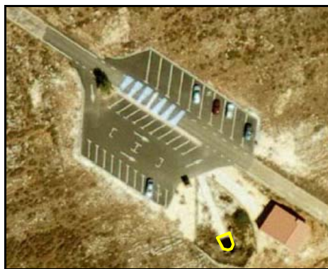
Ejemplos de Cueva