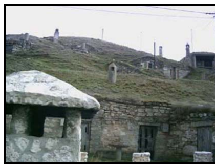
Ejemplos de accesos a cuevas.